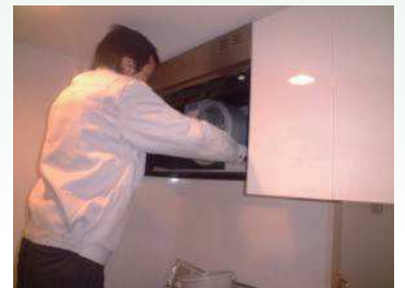
4. 部品取り付け及び 本体清掃・点検