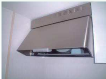
1. レンジフード清掃 お申し込み

※作業のお支払いは、●月分の管理費等と共に平成●年●月に所定の預金口座から自動振替させていただきます。