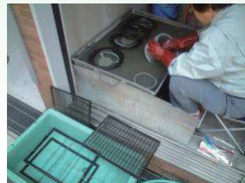
3. 取り外し部品洗浄